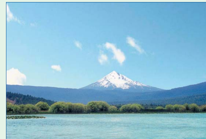
Klamath See, Oregon, USA

Blau-Grüne Süßwasser-Mikro-Algen Wild gewachsen im Klamath See